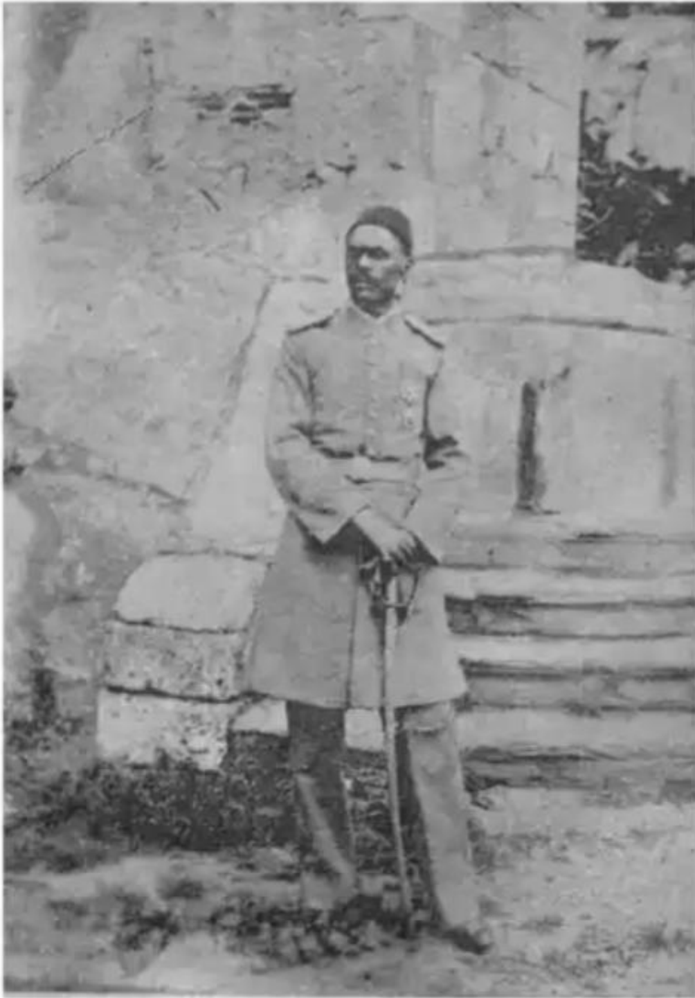
الفريق الزبير رحمت باشا